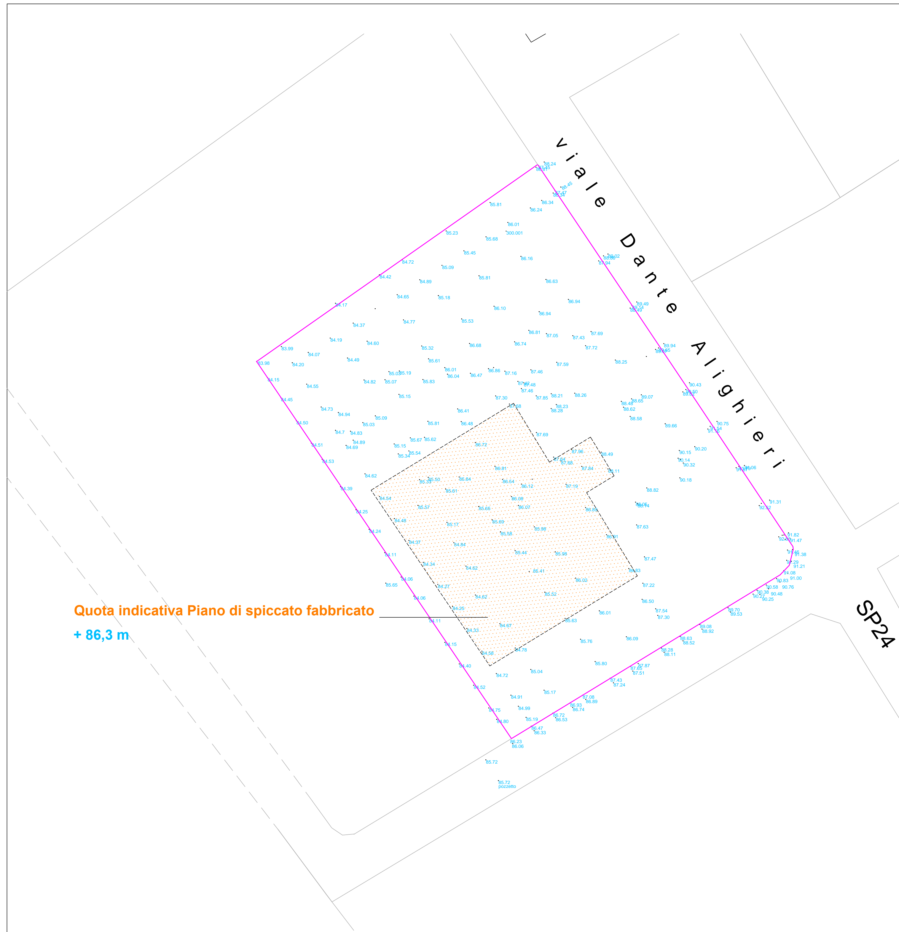
Rilievo topografico - capisaldi di riferimento e piano spiccato singoli edifici 1: 500