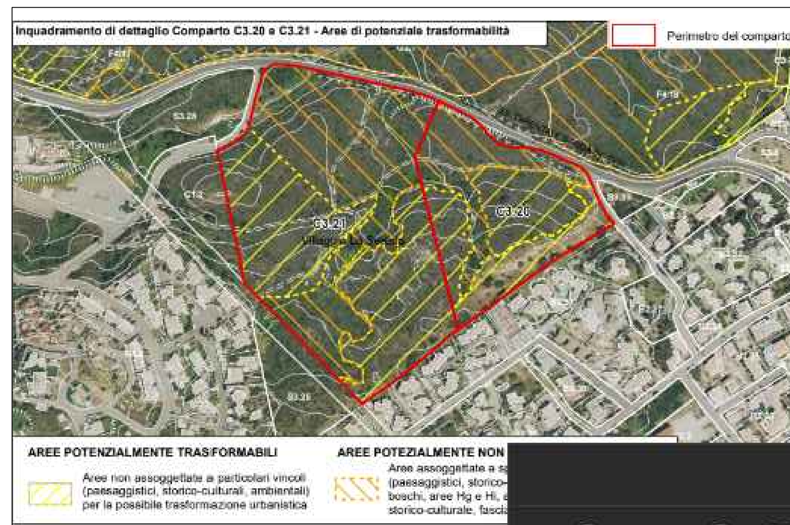
PUC. AREE EDIFICABILI

COMUNE DI LOIRI PORTO SAN PAOLO PROVINCIA DI SASSARI