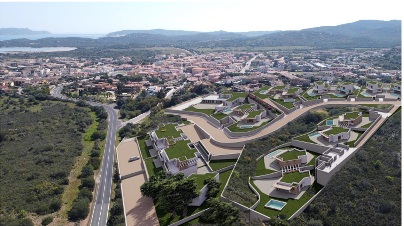
Simulazione degli interventi