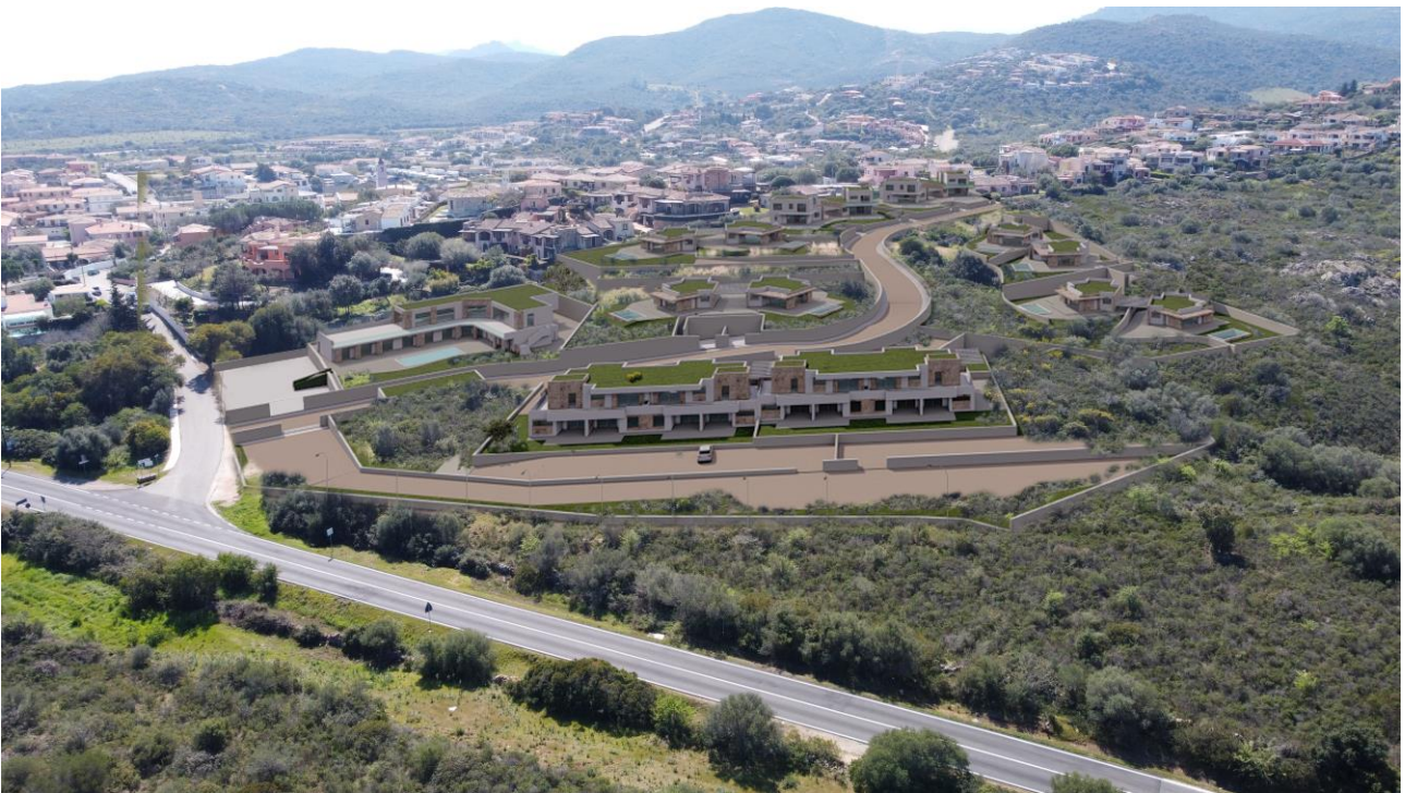
Simulazione degli interventi