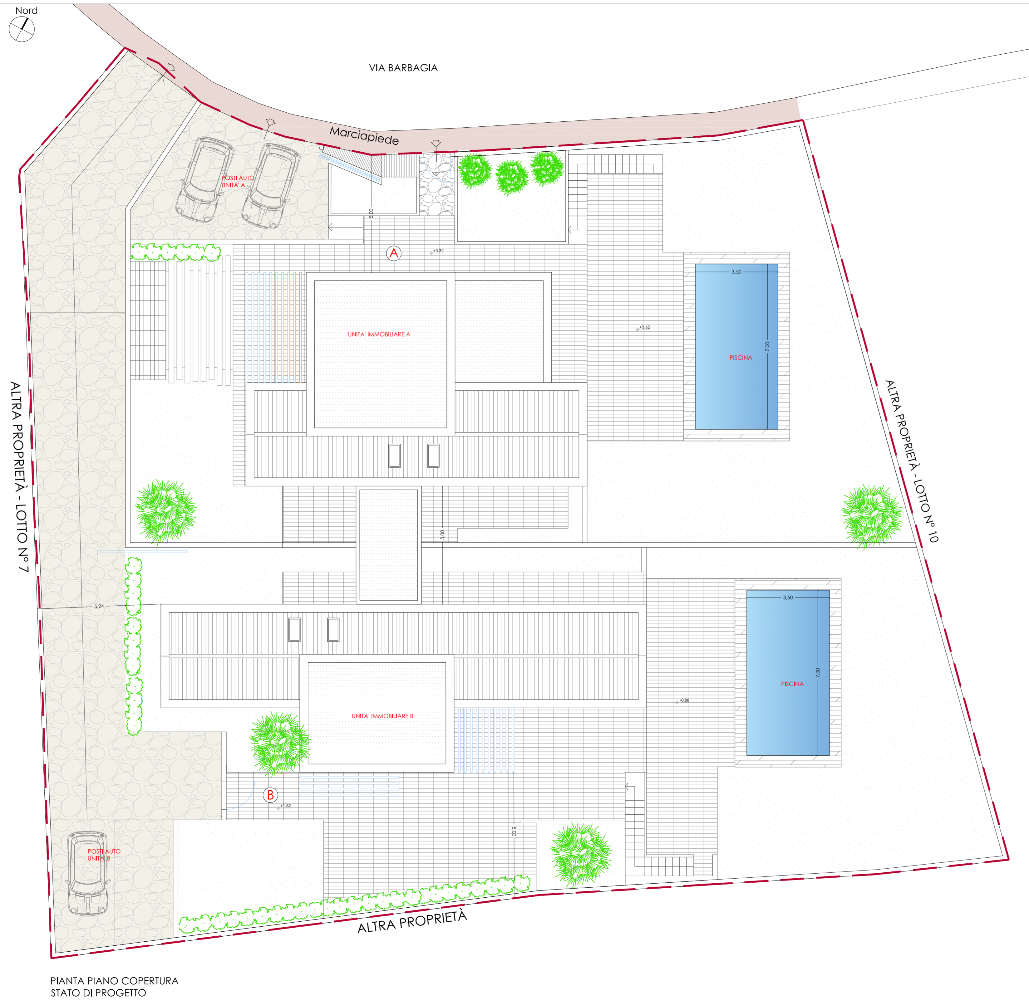
PIANTA PIANO COPERTURA STATO DI PROGETTO